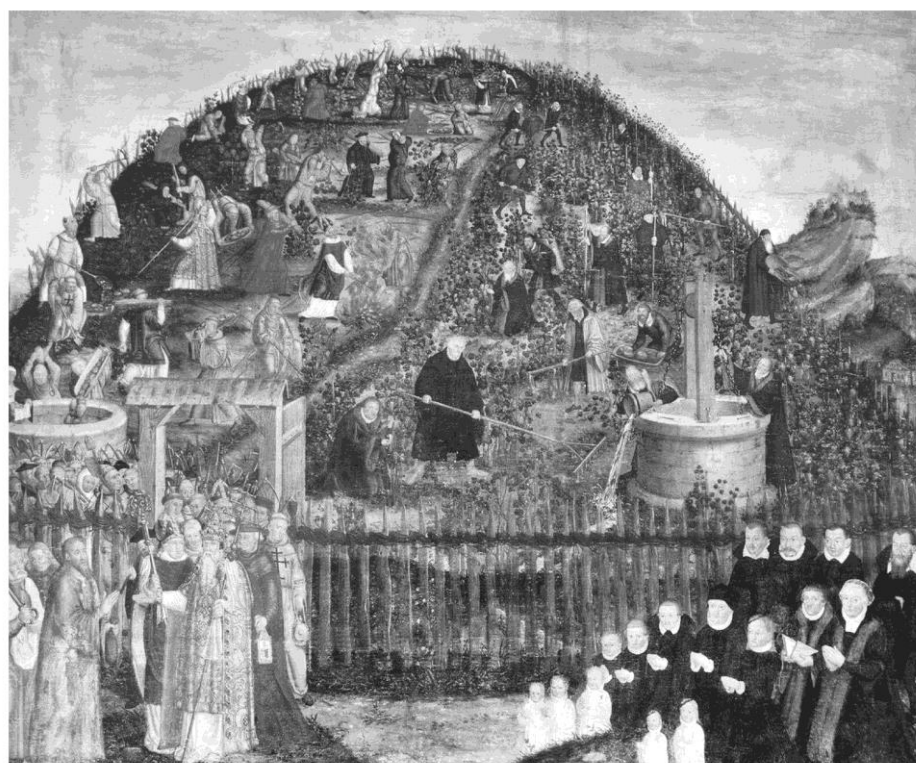
(Lucas Cranach d. J., Epitaph für Paul Eber, Stadtkirche Wittenberg (Ausschnitt),)

» Zuletzt sandte er seinen Sohn zu ihnen; denn er dachte: Vor meinem Sohn werden sie Achtung haben. Als die Winzer den Sohn sahen, sagten sie zueinander: Das ist der Erbe. Auf, wir wollen ihn töten, damit wir seinen Besitz erben. Und sie packten ihn, warfen ihn aus dem Weinberg hinaus und brachten ihn um. «